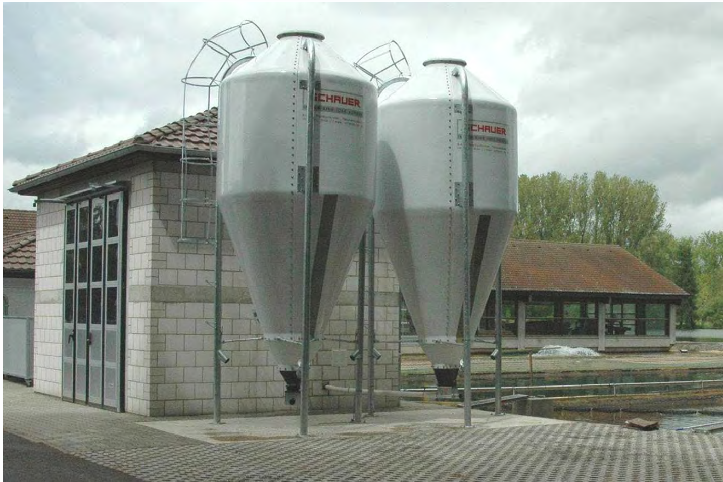
Futterhaus Fischzucht Ramail Fritzlar mit SpotmixFISH