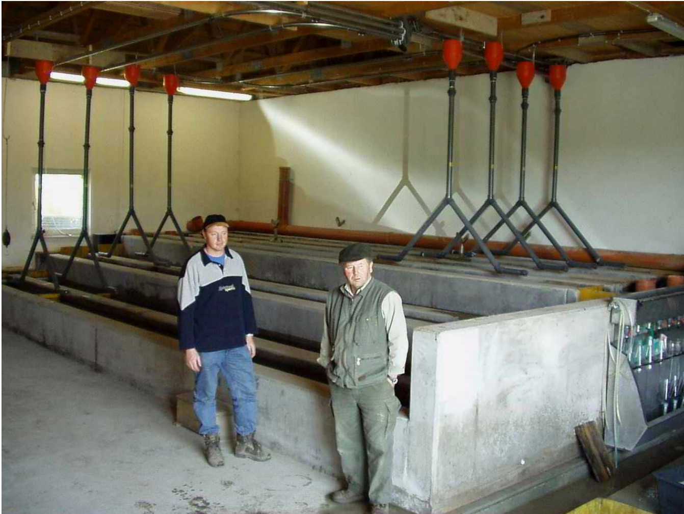
Bruthaus Fischzucht Ruf Lechmühle