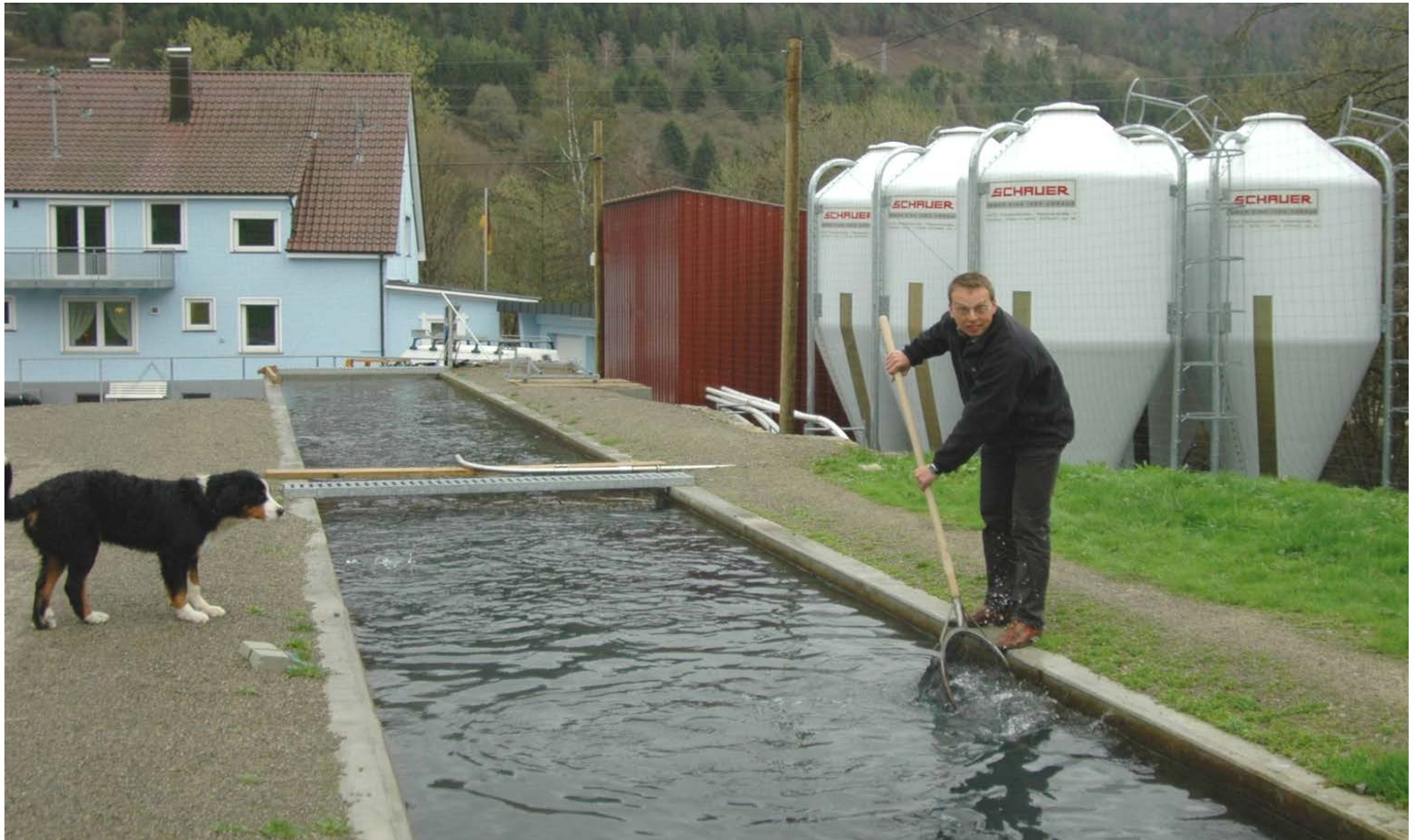
Kanalanlage Fischzucht Hofer Oberndorf