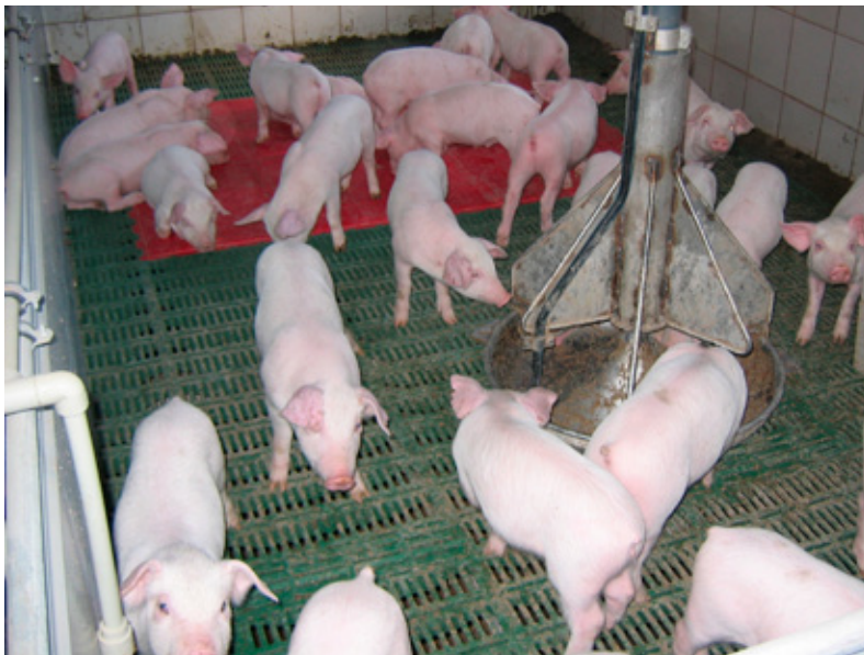
Фото 2. Маленьких поросят в «Бастионе» кормят кашей

ятий племенного и откормочного направления, где используются дорогие престартеры.