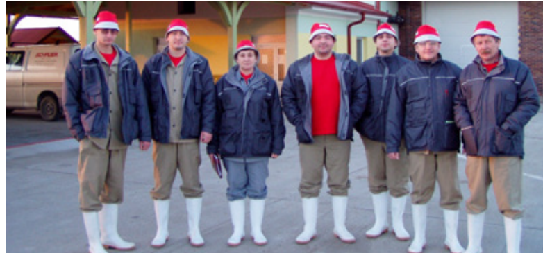
Фото 1. Владельцы и специалисты предприятия проходили учебу в Словакии

ваться лучшего соотношения энергии и протеина.