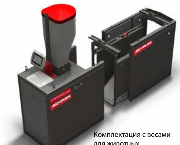
Комплектация с весами для животных